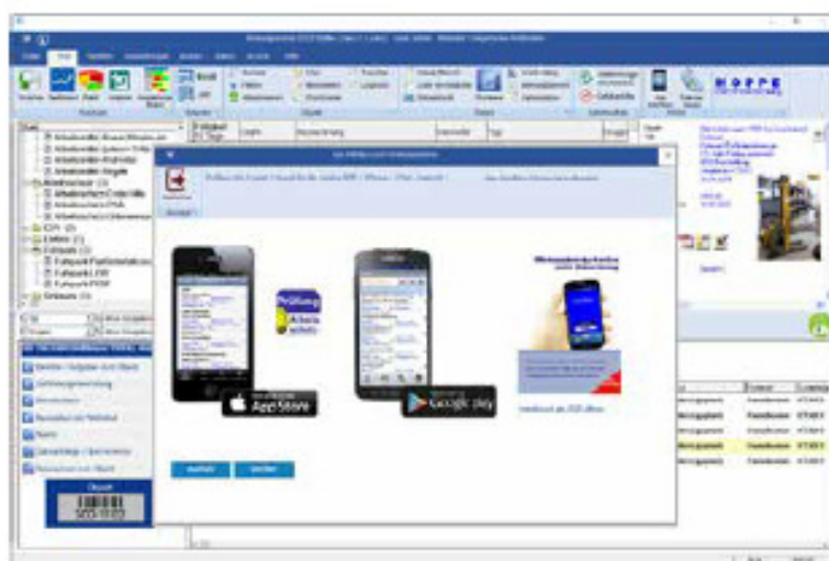
Mobile Erfassung mit dem Wartungsplaner