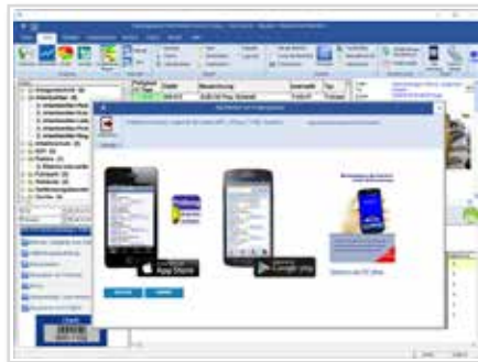
↑ Mobile Erfassung mit dem Wartungsplaner